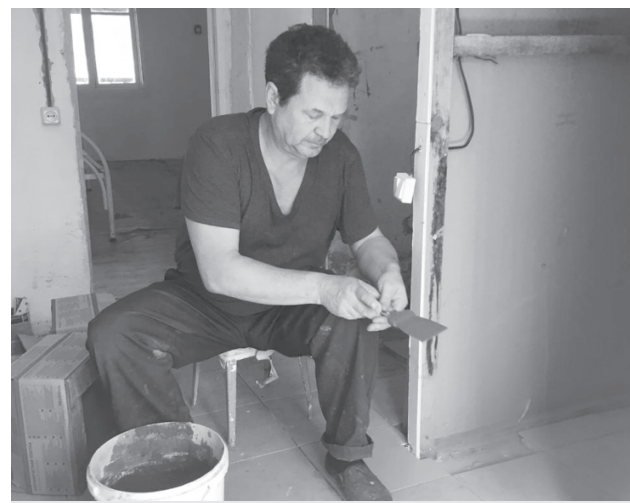
Подготовка к летней оздоровительной кампании в лагере "Дубрава" не останавливается ни на минуту

"Дубрава", в котором также активно ведутся подготовительные работы. Всего в летней оздоровительной кампании в ДОЛ "Дубрава" запланирован отдых 317 человек. Из-за пандемии и связанных с этим ограничений, процент наполняемости детей в отрядах составит 75% от мощности лагеря. Численность отдыхающих не снизится в связи с запланированным запуском дополнительных помещений для размещения детей. Наполняемость в каждом отдельно взятом отряде составит 12 - 18 детей. Что касается сроков начала отдыха: первая смена запланирована с 14 июля по 3 августа, вторая смена - с 6 августа по 26 августа.